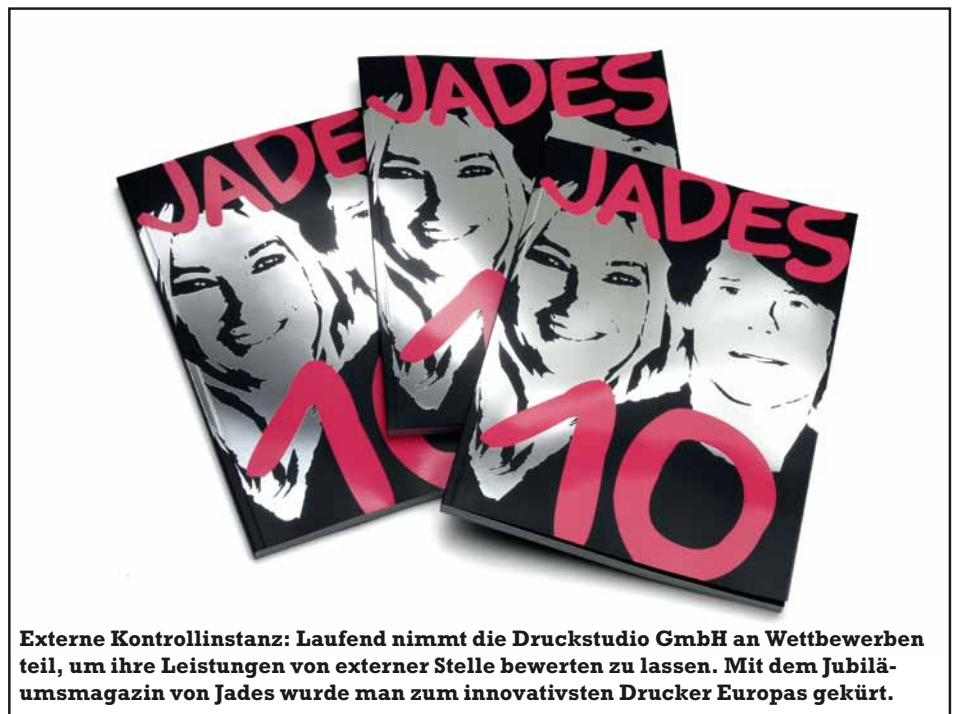
Externe Kontrollinstanz: Laufend nimmt die Druckstudio GmbH an Wettbewerben teil, um ihre Leistungen von externer Stelle bewerten zu lassen. Mit dem Jubiläumsmagazin von Jades wurde man zum innovativsten Drucker Europas gekürt.

Druckstudio GmbH Professor-Oehler-Straße 10-11 40589 Düsseldorf Tel.: 02 11 / 77 09 63-0 info@druckstudiogruppe.com www.druckstudiogruppe.com