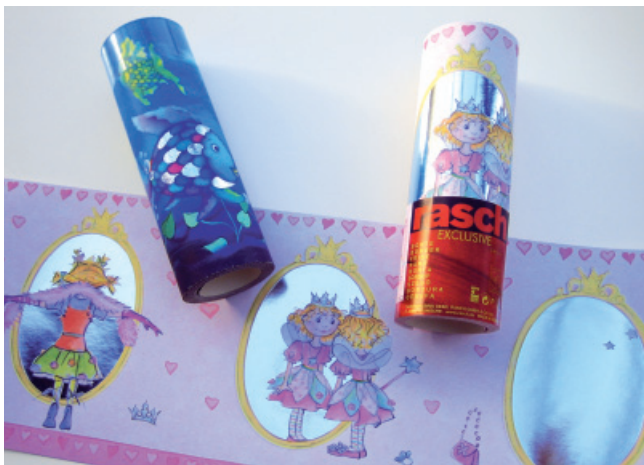
Deuschle: Tapetenbordüre mit Planprägung in Silber.

Telefon: 05223/65090-0, www.heidenreich-print.de