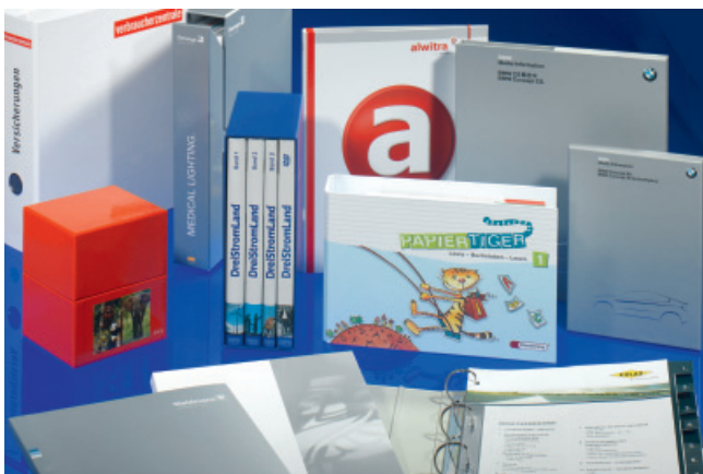
Achilles: Firmenindividuelle Präsentationsprodukte für Industrie, Handel und Dienstleistung sind ein wichtiges Standbein des Veredlers.