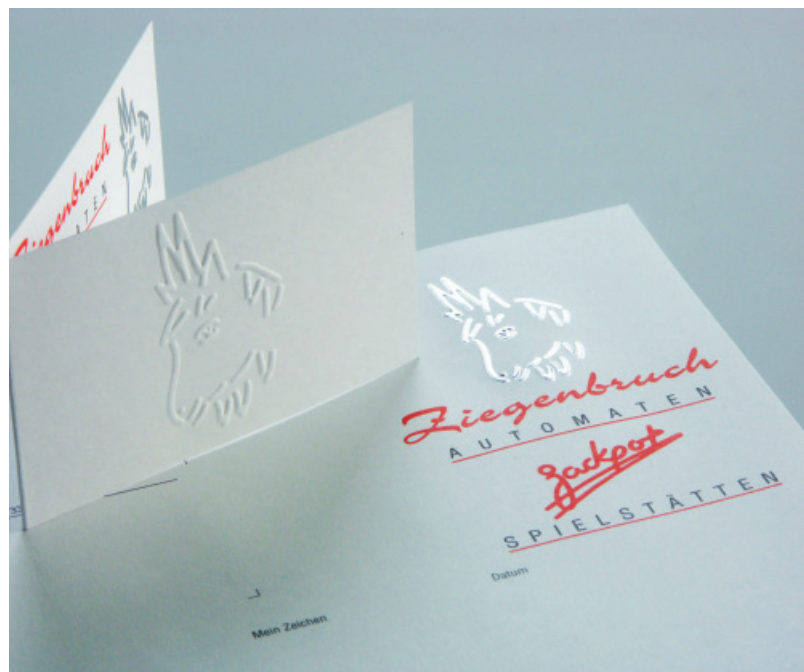
Die Gräfe Veredelungsgruppe bietet ein breites Spektrum an Veredelungsverfahren an, mit denen sich zum Beispiel auch solche veredelten Geschäftskarten fertigen lassen.

betrieb über die Jahrzehnte hinweg konsequent weiterentwickelt hat. Inzwischen agiert das Unternehmen in vielen Teilbereichen weltweit. Zum Kundenstamm von Nickert gehören unter anderem Buchverlage, Druckereien, Medien-dienstleister, Agenturen, Künstler oder Duplizierer. Telefon: 0731/97010-0, www.nickert.de